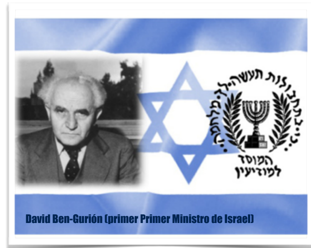
David Ben-Gurion (primer Primer Ministro de Israel)

"Y tú, hijo de hombre, profetiza a los montes de Israel, y di: 'Montes de Israel, oigan la palabra del SEÑOR....Así dice el Señor DIOS a los montes y a las colinas, a las barrancas y a los valles, a las ruinas desoladas y a las ciudades abandonadas, que han venido a ser presa y escarnio de las demás naciones alrededor...Yo he hablado en mi celo y en mi furor porque han soportado los insultos de las naciones. Pero ustedes, montes de Israel, echarán sus ramas y producirán su fruto para Mi pueblo Israel; porque pronto vendrán".