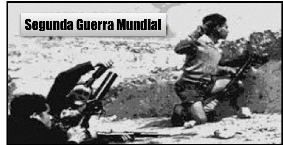
Segunda Guerra Mundial

La inmigración ilegal fue el principal método de inmigración porque la cuota británica permitía la entrada sólo a 18,000 judíos por año. Sesenta y seis barcos con inmigrantes fueron movilizados durante esos años, pero solamente unos pocos lograron atravesar el bloqueo británico para alcanzar las orillas de Israel. Los británicos detenían los barcos que transportaban inmigrantes, y éstos eran internados en campamentos de refugiados en Chipre. La mayoría no pudo llegar a Israel hasta después de haberse establecido como nación. Cerca de 80,000 inmigrantes ilegales llegaron a Israel entre 1945-48. El número de inmigrantes durante todo el período del Mandato Británico, tanto legal como ilegal, fue aproximadamente 480,000, casi el 90% desde Europa. Cuando se estableció Israel como estado en 1948, la población judía en la tierra había alcanzado unas 650,000 personas.